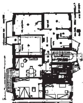
Pianta della casa in linea di Cesare Ligini (c).

s'incontrano i cinque edifici in linea disposti a pettine rispetto all'andamento della strada, diversificati nella volumetria grazie all'alternanza di alloggi disposti su 2 e 3 livelli. Nei primi due (b), progettati da Ena, si può notare la composizione del binomio loggia/balcone nei prospetti occidentali, mentre sono altresì da rilevare i coronamenti traforati dei terrazzi di servizio nei restanti blocchi, differenziati anch'essi dal trattamento delle aperture: due ampi balconi nel primo, firmato da Ligini (c), e alternanza di piccoli balconi a finestre senza logge negli altri due, disegnati da Monaco (d).