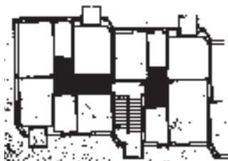
Pianta e prospetto tipo delle case in linea ad andamento spezzato di Mario De Renzi e Saverio Muratori (e).

fila di finestre e dei balconcini. Lo stesso ritmo si ritrova, più serrato, nel lungo edificio in linea spezzato (e), nel quale la facciata è ulteriormente arricchita da scatti modulari che propongono una inconsueta varietà di vedute e una lettura del prospetto tutt'altro che monotona.