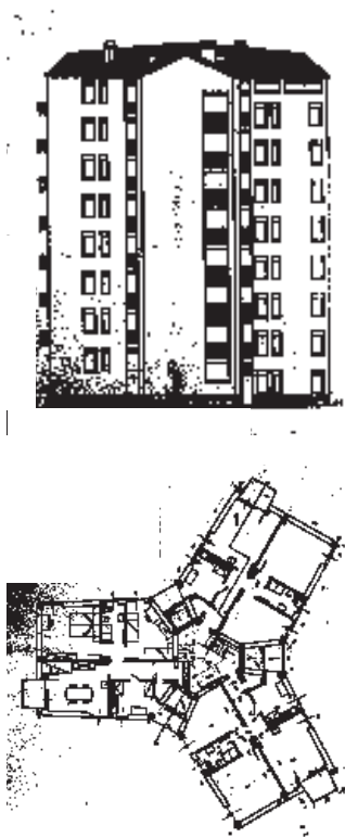
Pianta e prospetto tipo delle torri stellari di Mario De Renzi e Saverio Muratori (c-d).

Il ritmo delle facciate è tutto affidato all'alternanza, ripetuta e costante, dei segni verticali: dei corpi scala, della doppia